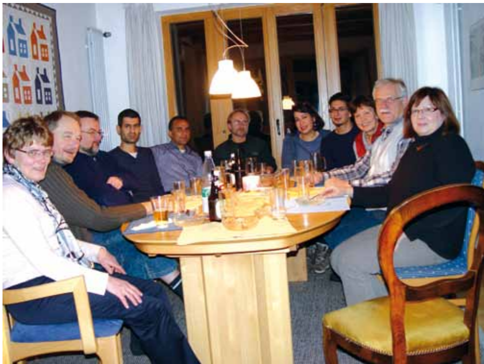
Vier iranische Freunde bei einer vorweihnachtlichen Feier mit Hauskreismitgliedern in München