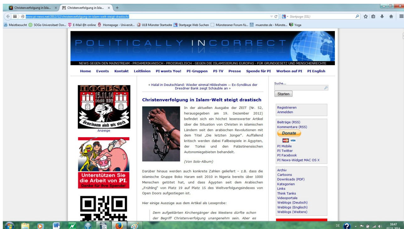
Abb. 3: PI-Screenshot (3.11.2014) mit HoGeSa-Werbung und Verzweckung des Themas Christenverfolgungen für antimuslimischen Rassismus.