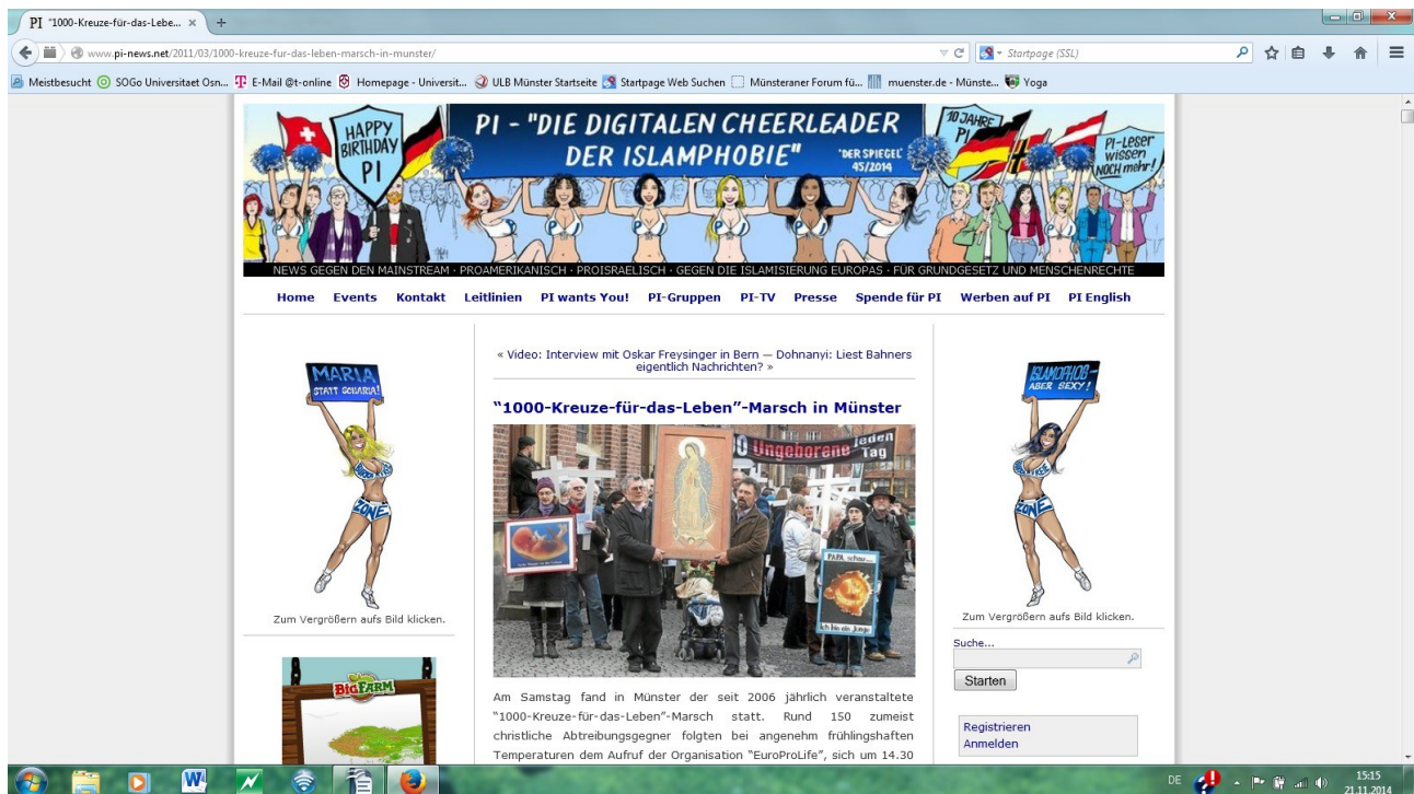
Abb. 2: PI-Screenshot (21.11.2014) mit Werbung mit dem NPD-Slogan „Maria statt Scharia“; zugleich abgebildet ein Bericht über den „1000-Kreuze-Marsch“ 2011 in Münster.