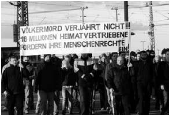
Der sog. „Trauermarsch“ der Jungen Landsmannschaft Ostdeutschland am 16. Februar 2008 in Dresden.

In Druckwerken und Liedtexten rechtsextremer Parteien und Gruppen tauchen immer wieder geographische Bezeichnungen mit Bezügen zum „Großdeutschen Reich“ auf: So wird „Mitteldeutschland“ als Bezeichnung für die ostdeutschen Bundesländer benutzt, weil „Deutschland“ für die extreme Rechte bis nach Ostpreußen reicht. Die „Ostmark“ steht nach einem Sprachgebrauch Hitlers für Österreich und gehört im rechtsextremen Weltbild ebenfalls zu den „deutschen Landen“.