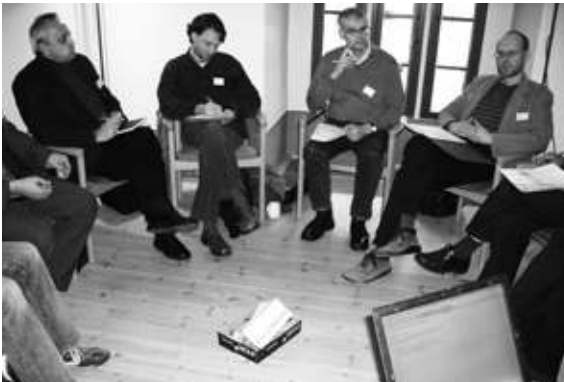
Teilnehmende des 3. Praxistages diskutieren zu den Themen „Heimat“ und „Patriotismus“.

In den zurückliegenden Jahren haben wir ein Modell für das Veranstaltungsprogramm entwickelt. Es hat oftmals einen Bezug zu regionalen Entwicklungen und Ereignissen. Darüber hinaus teilt es sich meist in drei Teile. Die Teilnehmenden erhalten zunächst in Form von Beiträgen Informationen zur Thematik. Anschließend besteht die Möglichkeit, sich in