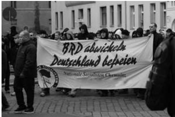
Nationale Sozialisten Chemnitz auf einer Demo am 12.1.2008 in Leipzig.

Aus diesen Zitaten wird eines überdeutlich: Die NPD ist – trotz des demokratischen Anspruchs in ihrem Namen – eine antidemokratische Partei und trachtet danach, das bestehende politische und gesellschaftliche System durch ein anderes auszutauschen, das auf dem völkisch-rassistischen Solidarismus basiert und zentrale Menschenrechte verletzt. Der Einzelne soll sich nicht als selbstbestimmt handelndes Individuum begreifen, sondern sich der Volksgemeinschaft bzw. einer Partei, die sämtliche gesellschaftliche Bereiche durchdringt und organisiert, unterordnen. Der Rechtsextremismus negiert somit die universellen Freiheits- und Gleichheitsrechte des Menschen.