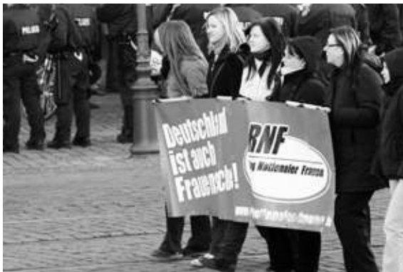
Vertreterinnen des Ringes Nationaler Frauen bei einem Aufmarsch 2008 in Dresden.