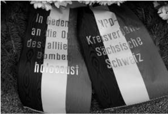
Die Hälfte aller Kränze beim Gedenken an die Opfer des 13. Februars 1945 in Dresden wurden 2008 von rechtsextremen Gruppierungen niedergelegt.

eigenen Denkmals als Mahnmal gegen Krieg und Gewalt herzustellen. Das Bürgerbündnis (s. o.) könnte dafür ein guter Ort sein. Gegebenenfalls lässt sich diese Sinngabe durch eine entsprechende Beschilderung unmissverständlich ausdrücken, die auf die ungezählten Leiden eines jeden Krieges verweist und darum die Lebenden zum Frieden mahnt.