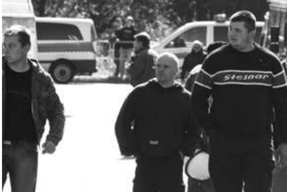
Die Modemarke Thor Steinar dient als Erkennungsmarke der rechtsextremen Szene.

bundesdeutsche Gesellschaft zu sensibilisieren. Denn die Verbreitung dieser Marke führt nicht nur zu einer gefährlichen Normalisierung rechter Symbole in der Alltagswelt. Die mediatrix GmbH, die Thor Steinar vertreibt, verzeichnet hohe Umsätze. In zahlreichen Ladengeschäften, deren Existenz zu großen