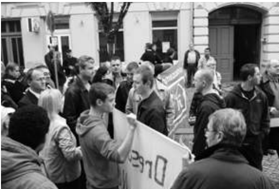
Das Bürgerfrühstück der Bürgerinitiative Pieschen gegen Rechts aus Dresden wurde von Rechtsextremen gestört.

Seit dem Einzug der NPD in den Sächsischen Landtag im Herbst 2004 geben sich die Rechtsextremen selbstbewusster. Dies zeigt sich in der Umsetzung der Wortergreifungsstrategie, die die Möglichkeit bietet, diejenigen Teile der NPD zu befriedigen, die eine Normalisierung der Partei vorantreiben wollen: Man zeigt Präsenz in öffentlichen Veranstaltungen und muss sich als Mitglied einer zugelassenen Partei nicht verstecken. Gleichzeitig kommt sie den Wünschen der Freien Kräfte nach eher aktionsorientierten Formen entgegen – ein Spagat, der bei anderen Aktionsformen eher schwer realisierbar ist.