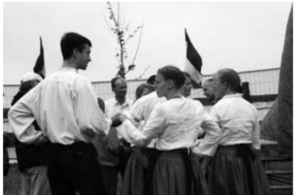
Der sog. Sachsentag der Jungen Nationaldemokraten 2006 in Dresden-Papritz bot nicht nur RechtsRock-Musik.

Der Bezug zu Germanentum und Brauchtum spielt für die rechtsextreme Szene und Parteien eine große Rolle. Entsprechend werden Sonnenwendfeiern und Germanische Zehnkämpfe angeboten. Schwerpunktmäßig sind das eher Aktionsformen, die von den so genannten Freien Kameradschaften organisiert werden. In der ostsächsischen Kleinstadt Seiffhennersdorf organisiert die dortige „Kameradschaft