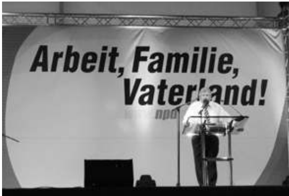
NPD-Vorsitzender Udo Voigt bei einer Wahlveranstaltung der NPD 2005 im sächsischen Riesa.

= Volksmenge, Pöbel). Zunächst errichtet Gott durch den Bund mit Abraham (1. Mose 15,18) eine Lebensgemeinschaft mit seinem wandernden Volk (am). Aus Ägypten unter der Führung des Mose erlöst, heißt es dann am Sinai: „ Werdet ihr nun meiner Stimme gehorchen und meinen Bund halten, so sollt ihr mein Eigentum sein vor allen Völkern; denn die ganze Erde ist mein. “ (2. Mose 19,5). Im Unterschied zu den heidni-